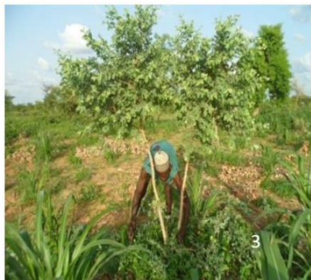
Figure 3 : Pratique de la régénération naturelle assistée