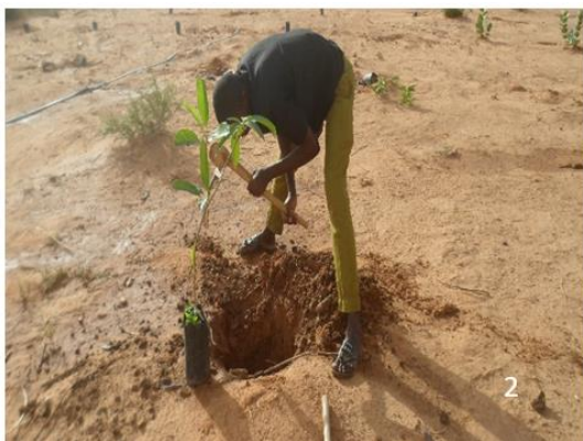
Figure 2 : Pratique de plantation d'arbre

La méthode adoptée dans cette étude a consisté à dresser des comptes d'exploitation selon la perception des pratiquants de la RNA et ou de la plantation pure ( Figure 2 et 3 ). L'option à retenir est donc celle qui permet d'obtenir la différence la plus élevée possible entre les avantages et les coûts. Aussi, les données qualitatives constituées des informations sur les avantages et inconvénients de la pratique de la RNA et la plantation des ligneux, sur les caractéristiques socio-économiques des producteurs, le type de sols, la distance et mode d'acquisition de champs de chaque pratique ont été utilisés. Toutes ces données ont été complétées par des entretiens au niveau des structures étatiques et associations paysannes.