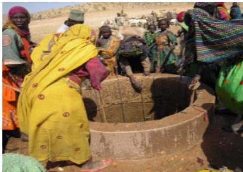
Figure 2a : Eaux souterraines, puits cimentés