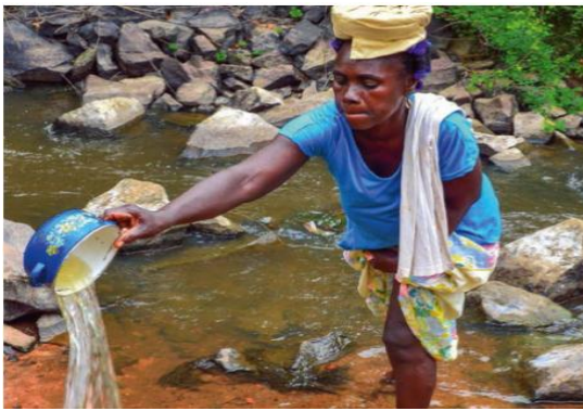
Figure 1a : Eaux de surface, cours d'eau

Les eaux de surface sont utilisées par les éleveurs et les villageois comme illustrées par la Figure 1a . Cependant, les déficits pluviométriques liés à la variabilité climatique ne favorisent pas leur utilisation durable. Elles constituent les sources potentielles de maladies diarrhéiques.