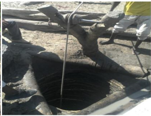
Figure 1b : Puits traditionnels à ciel ouvert

Les eaux souterraines sont exploitées au moyen des points d'eau traditionnels et modernes. La Figure 1b montre les Points d'Eau Traditionnels (PET) réalisés à l'aide des matériaux locaux (bois ou herbes). Leur durée de vie est très limitée et ils font l'objet d'un décreusage annuel. Les Points d'Eau Modernes (PEM) sont constitués de puits modernes et de Pompe à Motrice Humaine (PMH). Les puits modernes sont cimentés ou en béton armé indiqués sur la Figure 2a . Ils sont à ciel ouvert par conséquent les eaux sont insalubres. Par contre, la Figure 2b illustre un forage à motricité humaine avec des eaux non polluées mais un débit faible.