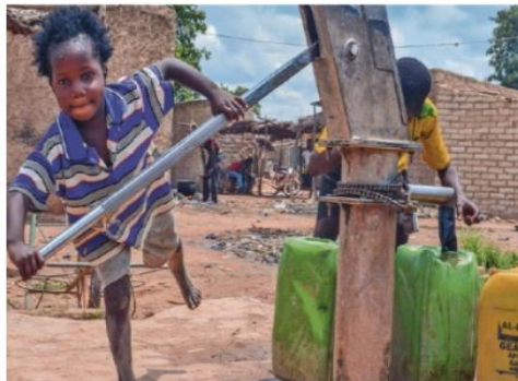
Figure 2b : Forage à motricité humaine

Les stations de pompage d'Adduction d'Eau Potable (AEP) thermique ou solaire comportent un forage contenant une pompe immergée électrique. Ces stations produisent de l'eau potable en grand débit. La société d'Etat chargée de la distribution d'eau potable implantée dans 11 villes ne desservait que 25 % de la population en 2010 et est souvent confrontée à la crise énergétique [3].