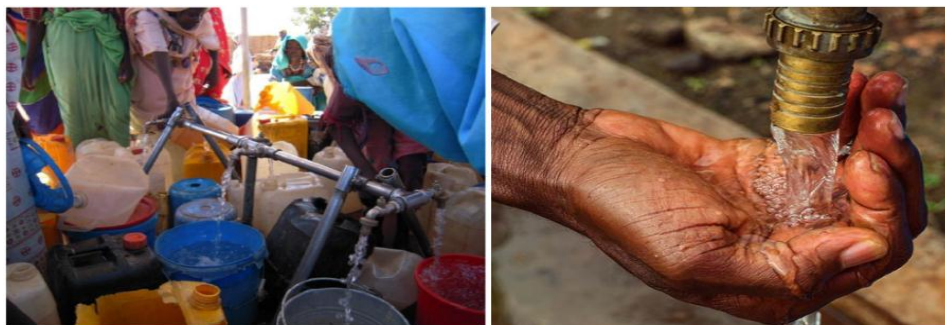
Figure 3 : Eaux souterraines, borne fontaine d'un forage moderne (AEP)

Les stations de pompage d'Adduction d'Eau Potable (AEP) thermique ou solaire comportent un forage contenant une pompe immergée électrique. Ces stations produisent de l'eau potable en grand débit. La société d'Etat chargée de la distribution d'eau potable implantée dans 11 villes ne desservait que 25 % de la population en 2010 et est souvent confrontée à la crise énergétique [3].